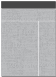
Superbanner or billboard