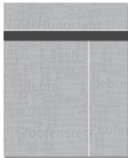
Hockeystick, wallpaper or tandem-ad